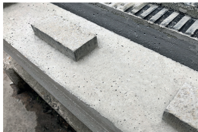
Halteklötzchen aus faserverstärkten Beton.